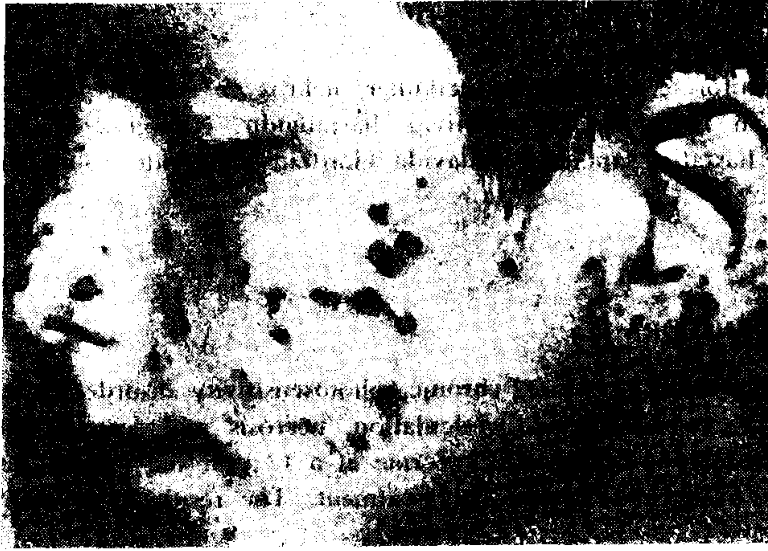
Şekil 1 : Olgumuzun yüzündeki lezyonlar.

Dermatolojik muayenede : Burun kanatlarında, yanaklarda, kulak heliksinde 1-4 mm. çaplarında, çok sayıda papülo-püstüler lezyonlar var. Bazılarının ortasında ülserasyon, bazılarının ortasında ise kahverengi krutlar var. Bu elemanlar arasında çok sayıda hipopigmente, hafif deprime sikatrisler bulunuyor. Alın ve çenede de az sayıda papülo-püstüler elemanlar görüldü. Hastamızda ayrıca göz yaşarması var. (Şekil 1).