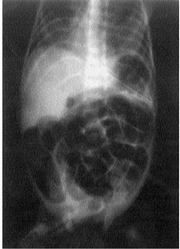
Şekil 2. Yutulan tüpün direkt grafideki görünümü.