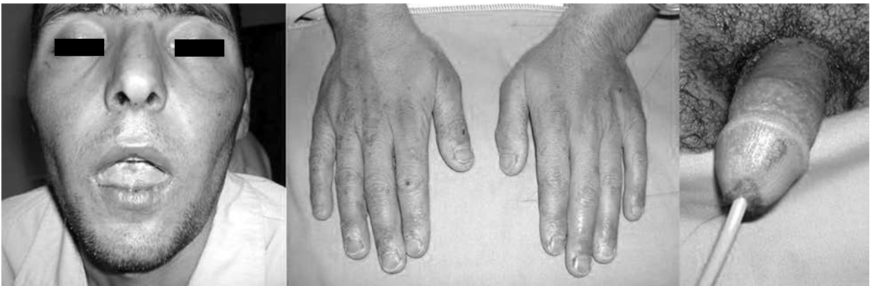
Şekil 1. Her iki elde hedef tarzı vezikülobüllöz lezyonlar, üretra çıkışında inflamasyon, stomatit lezyonları.

Hastanın tam kan sayımı, eritrosit sedimentasyon hızı, rutin biyokimyasal testleri, tam idrar tahlili, akciğer grafisi ve tüm batın ultrasonografisi normaldi. Grup ve brucella aglütinasyon testleri, gaitada gizli kan, gaitada parazit yumurtası, ve hemokültür negatif olarak bulundu. Boğaz kültüründe normal flora tespit edildi.