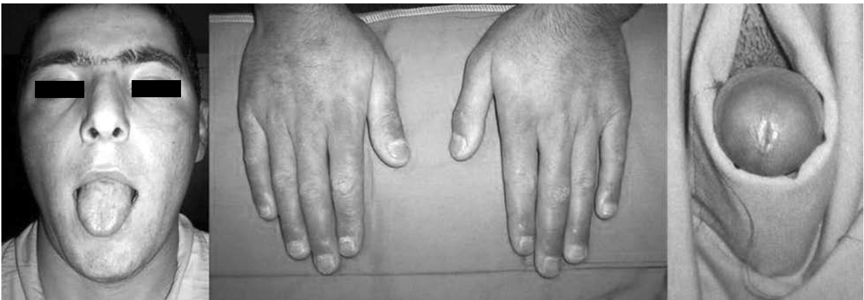
Şekil 3. Beş gün tedavi sonrası hastanın lezyonları tamamen iyileşti.

Stevens-Johnson sendromu için özel bir tedavi yöntemi bulunmamaktadır. Şüphelenilen ilacın kesilmesi tedavide ilk basamaktır ve destek tedavisi ile birlikte SJS tedavisinin temelini oluşturur. Şüphelenilen ilacın erken dönemde kesilmesi mortaliteyi önemli ölçüde azaltmaktadır. [9]