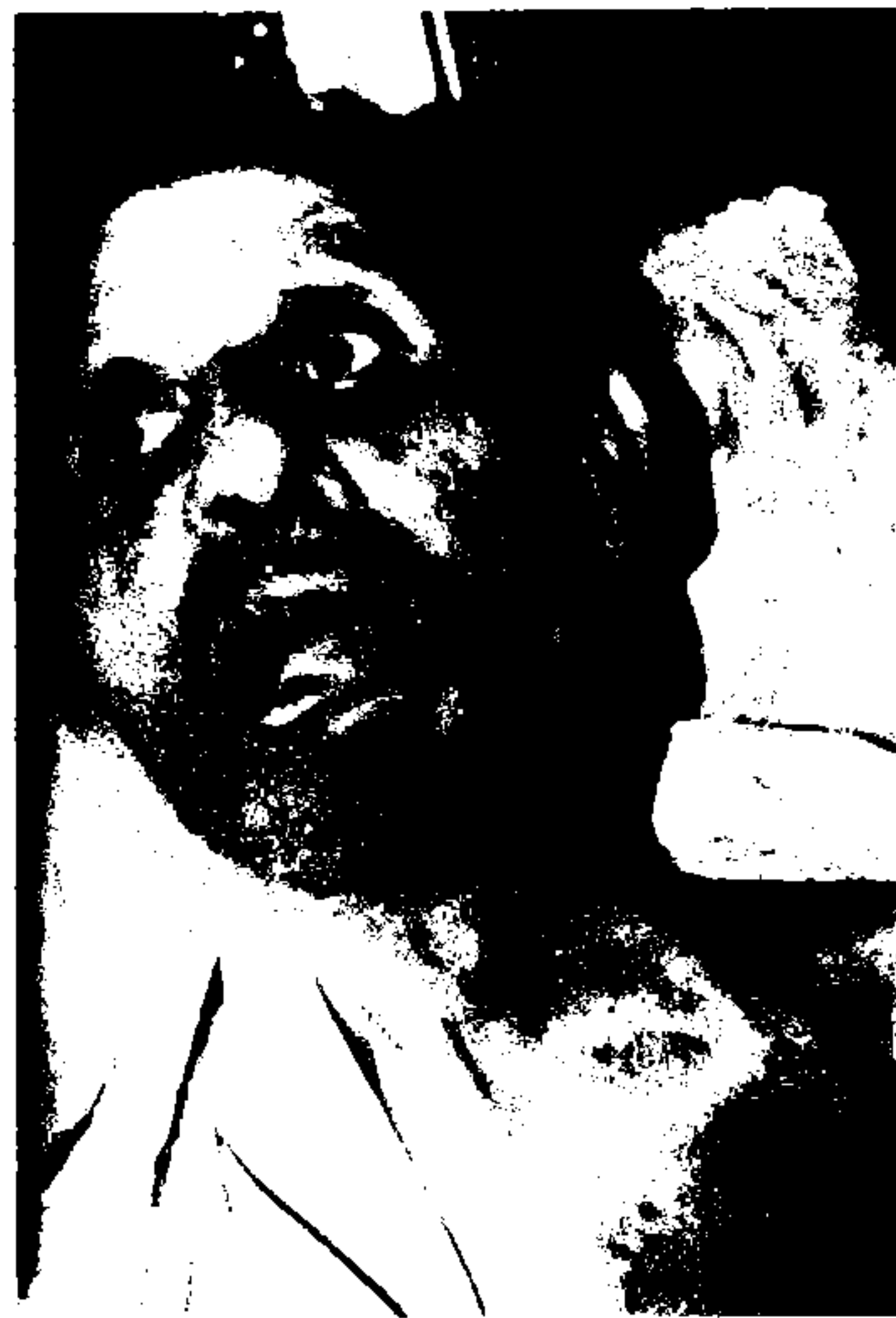
Resim VI: Hastanın geç dönemdeki görünümü.