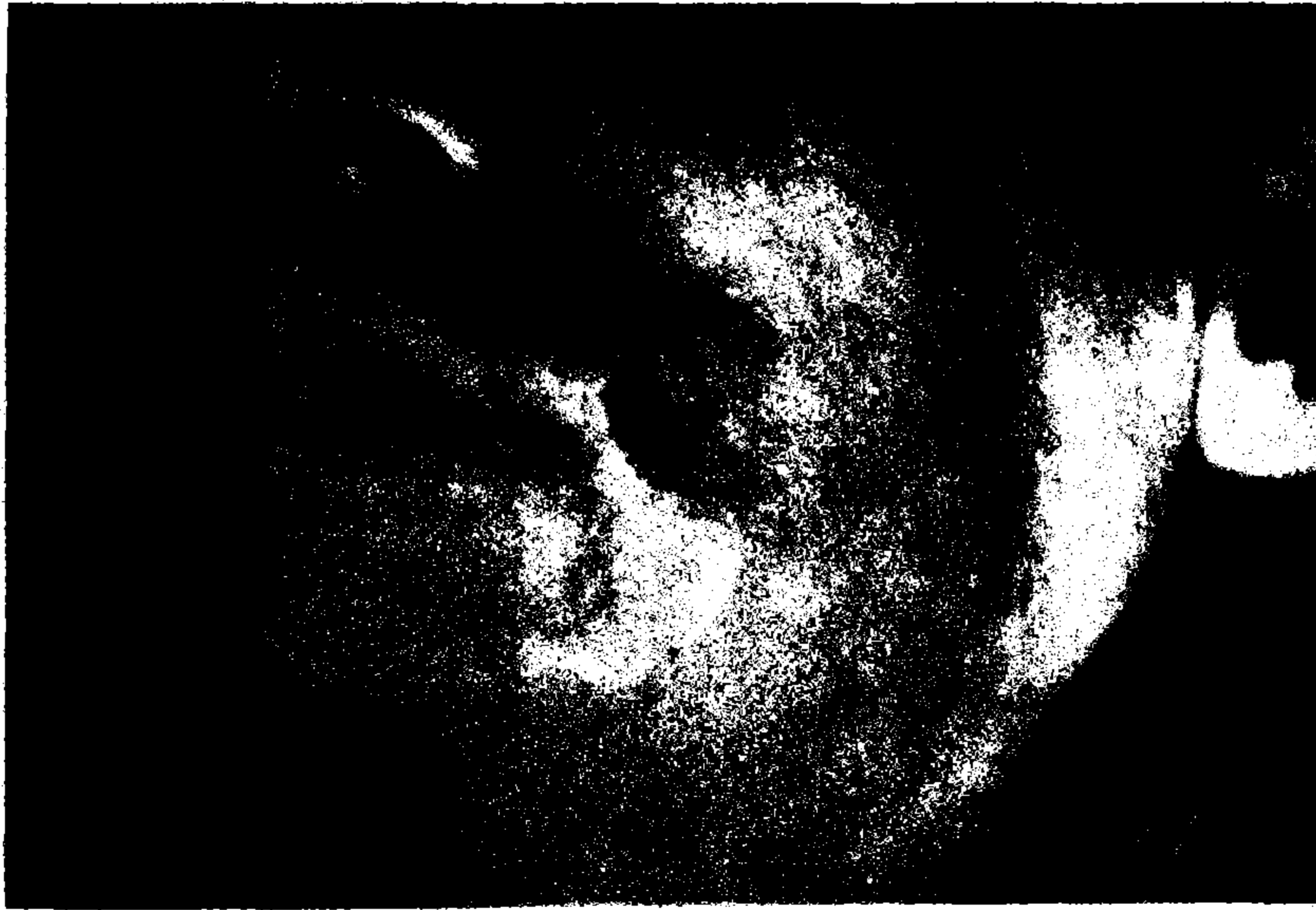
Resim I: Tümörün preoperatif görünümü.