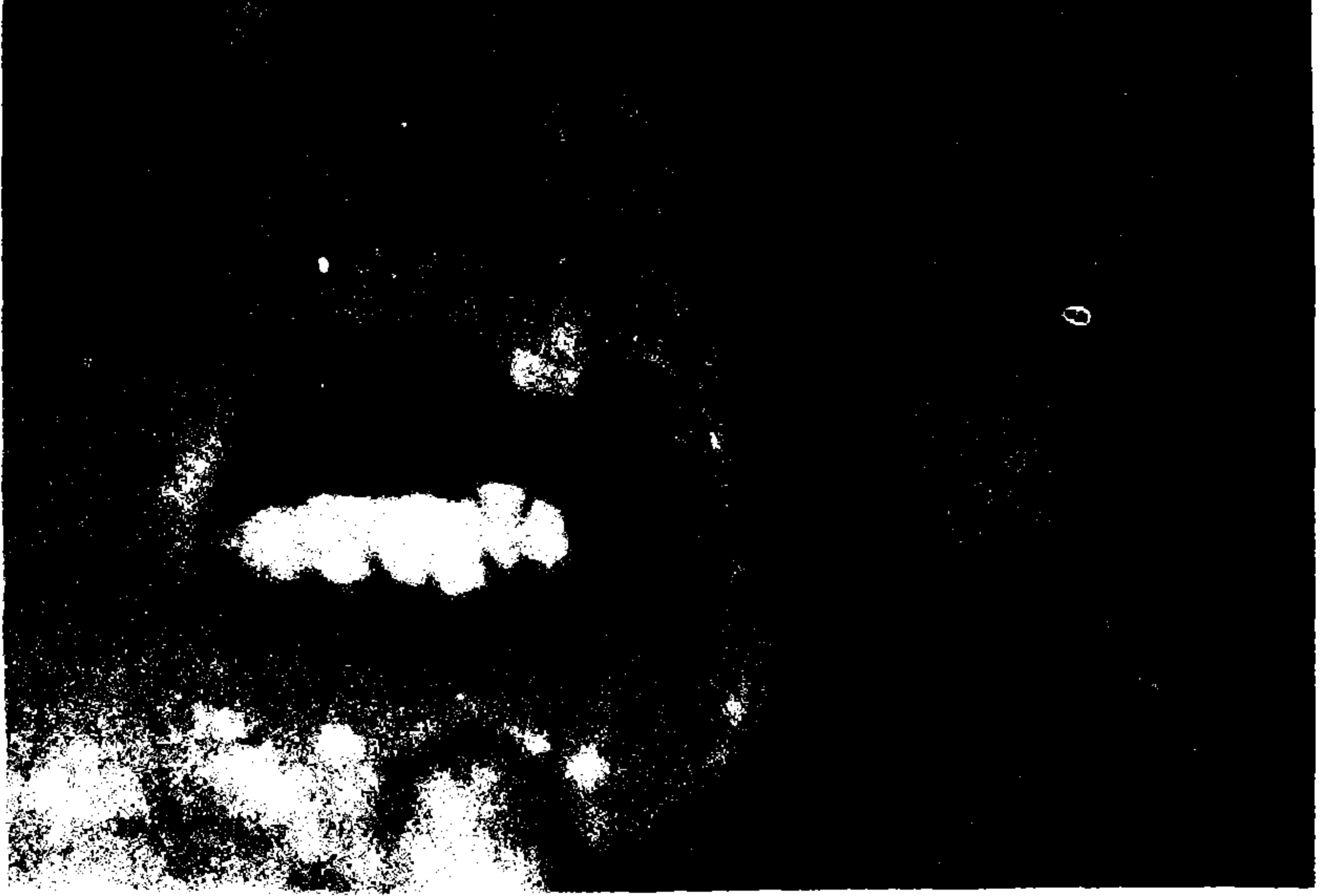
Resim II: Tümörün preoperatif görünümü.