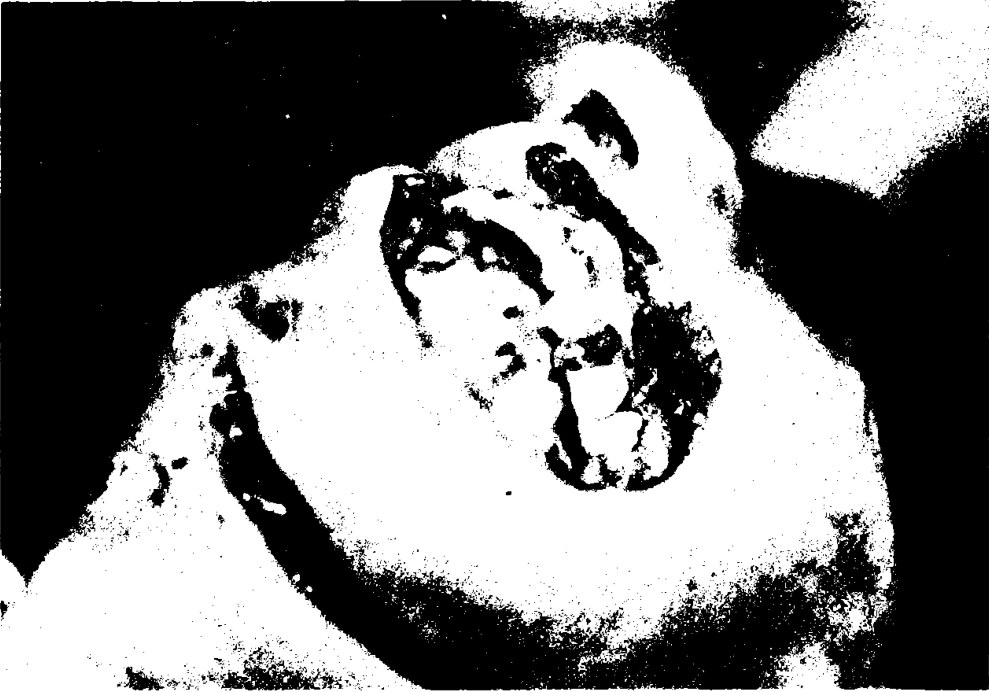
Resim III: Tümör eksizyonundan sonra defektin görünümü.