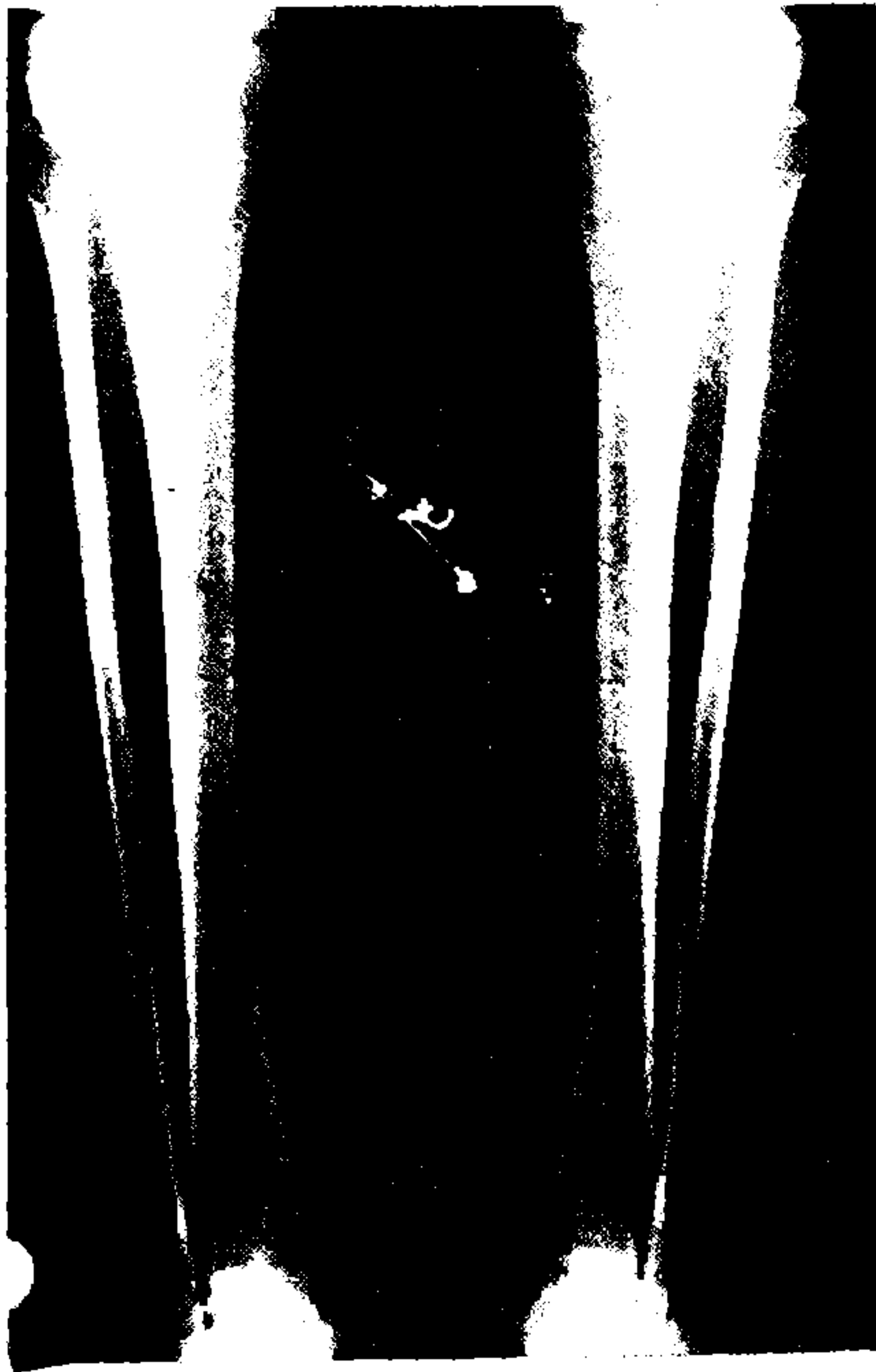
Resim 1: Stress kırığından şüphelenilen hastanın her iki kruris AP grafisi. Herhangi bir patoloji gözlenmiyor.

Hastaların 9'u erkek, 5'i kadındı ve yaş ortalaması 22,4 (16 ile 38 arası) idi. Hastaların 9'u spor akademisi öğrenci adayı, 4'ü spor akademisi öğrencisi, 1'i ise başka bir bölümde araştırma görevlisi idi. Tümünün ortak özelliği fizik aktivitelere alışık olmadığı veya antrenmansız olduğu halde, semptomlar başlamadan önce aşırı sportif aktivitelere başlamaları idi.