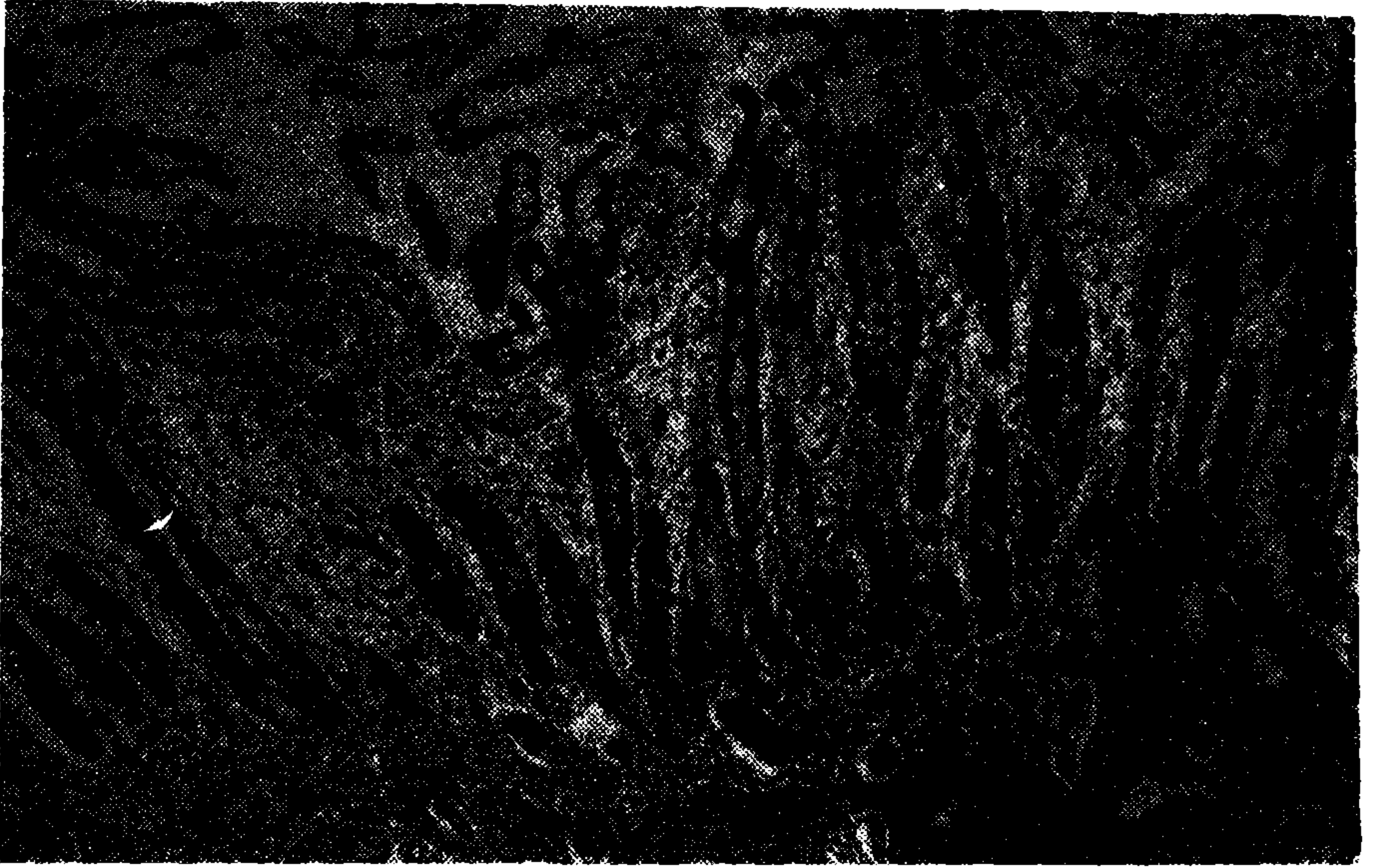
Resim 1. Mide mukozasında yüzey epitelinde ve bezlerde artmış goblet hücreleri, Lamina prop- riada lenfoplazmositer infiltrasyon muskularisin mukozanın her iki tarafından lenfatikler içerisinde tümör yayılımı görülmektedir.

Buna göre mide tümörleri, tümör çevresi mukoza değişiklikleri % 80,55 oranında atrofik ve bunun da % 62'si intestinal tip karsinom olarak tespit edilirken (Resim 1), % 8,3 oranında hipertrofik mukoza değişikliği gösteren vakalarımızın % 66'sının diffüz tip karsinoma olduğunu tespit ettik. % 11,1 vakamızda tümör çevresi mukoza değişikliğinde bir özellik göremedik.