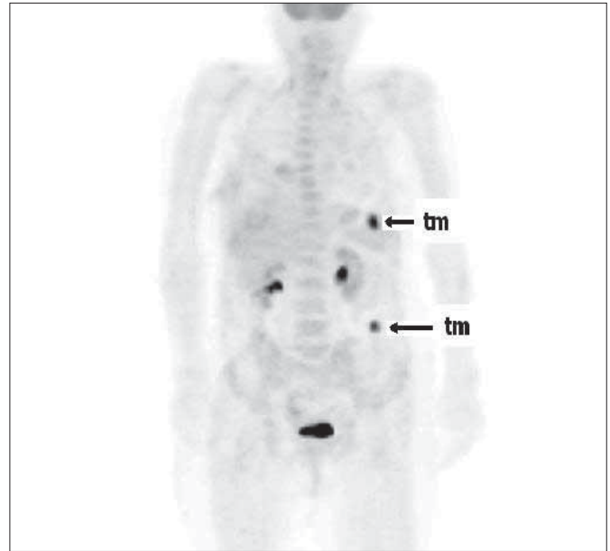
Şekil 1. 63 yaşında kadın hasta. Konvansiyonel yöntemler ile sadece sigmoid kolonda tümör tespit edilmişken, FDG-PET ile sigmoiddeki tümöre ilave splenik fleksurada senkron tümör saptanmıştır (tm: tümör)

Çalışmaya dahil edilen 26 hastada toplam 28 adet primer tümör odağı mevcuttu (iki hastada senkron tümör). FDG-PET ile 28 primer tümör odağının 27'si saptandı. SUVmax: 7.7 (3, 8-17, 6), duyarlılık: %96.4, pozitif öngörü değer (PÖD): %100 olarak hesaplandı. BT ise 28 primer tümör odağının 19'unu saptadı (duyarlılık: %67.8, PÖD: %95). FDG-PET primer tümörleri saptama bakımından BT'den etkili bulunmuştur (p=0,006). FDG-PET ile saptanamayan tümörün histolojisi "müsinöz adenokarsinom" olarak raporlandı. FDG-PET görüntülemeyle iki hastada, BT ve kolonoskopi ile saptanamayan, senkron tümör tespit edildi. Bu hastaların her ikisinde de BT ile sadece sigmoid kolonda tümör odağı tespit edilirken FDG-PET ile birinci hastada; sigmoid kolondaki tümöre ilave olarak splenik fleksurada senkron tümör saptanmıştır (Şekil 1). Her iki hastada, sigmoid kolonda lümeni tama yakın tıkayan primer tümör nedeniyle, kolonoskop ile proksimale geçiş imkanı olmadığından senkron tümör tanısı FDG-PET öncesi konulmamıştı. Senkron tümör tanısı intraoperatif gözlem ve histopatolojik sonuçlar ile de doğrulandı. Tümörlerin yerleşim yerleri ve yüzdeleri Tablo 1'de gösterilmiştir.